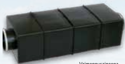
Vaimennusaineena hygieninen Dacron